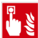
Piktogramm Handfeuermelder / Piktogramm

manuelle Handfeuermelder betätigen für Auslösung der Alarmierung im Gebäude und Alarmierung der Feuerwehr