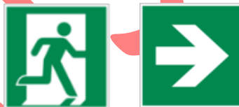
Piktogramm Rettungsweg / Notausgang (rechts) mit Richtungspfeil

Flucht- und Rettungswege sind durch entsprechende Zeichen aus der ASR A1.3 (Technische Regeln für Arbeitsstätten, Sicherheits- und Gesundheitsschutzkennzeichnung) gekennzeichnet.