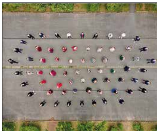
Abiturjahrgang 2020 Gymnasium Markneukirchen